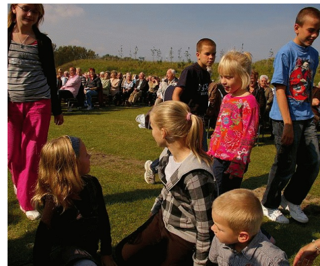
De volgende kans om hiervan te genieten komt op zondag 13 september 2009 13 september 2009

Niet alleen de dominee's hadden veel plezier op deze dag. Kinderen grepen de mooiste dag van de afgelopen maand september aan voor veel gezelligheid en spel, kale hoofden verbrandden rood terwijl de openluchtdienst door de medewerking van het combo Eljakim en het muziekkorps DES tot feestelijke hoogte werd getild.