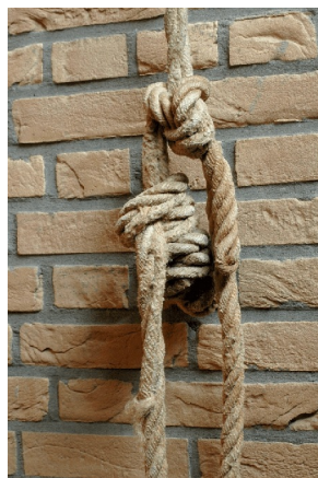
het touw van de klokkentoren elke donderdagochtend

Elke donderdagochtend zijn ze er weer, de gastheren en -dames in de Dorpskerk. Nadat u een ronde over de markt heeft voltooid -of voor u daaraan gaat beginnen, of als onderbreking- biedt de kerk ruimte voor een kopje koffie, een gesprek of een praatje, of een moment van stilte en bezinning.